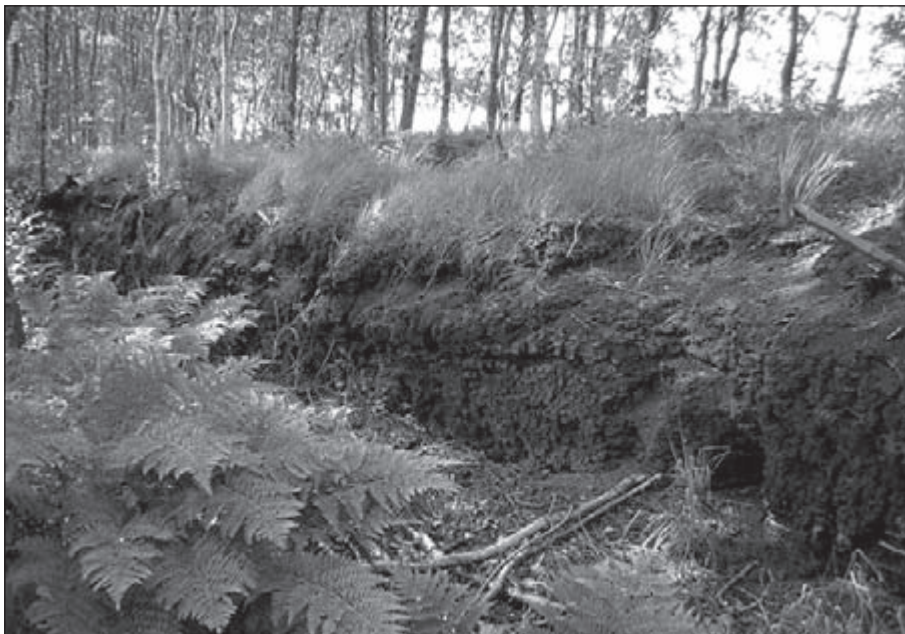
Restanten hoogveen in het Bargerveen

wel geprepareerd, maar niet voldoende kennelijk.