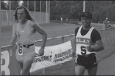
Clubkampioenschap 2005 8-9