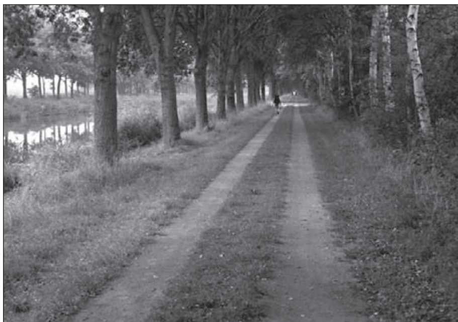
Langs het Boele Tijdenskanaal

Dus liepen we langs de Westerwoldse Aa verder, na een praatje met een hobbyboer. Het was eigenlijk wel een mooi stuk langs dat riviertje. In Wessinghuizen is een SVR-camping en daar sloegen we de tent op. Terwijl we druk bezig waren begon het te regenen. Het was gelukkig maar een kleine bui. Mijn pijp was voor vandaag echt leeg, na 27 km met bagage lopen. Na een voedzame maaltijd doken we vroeg de slaapzak in.