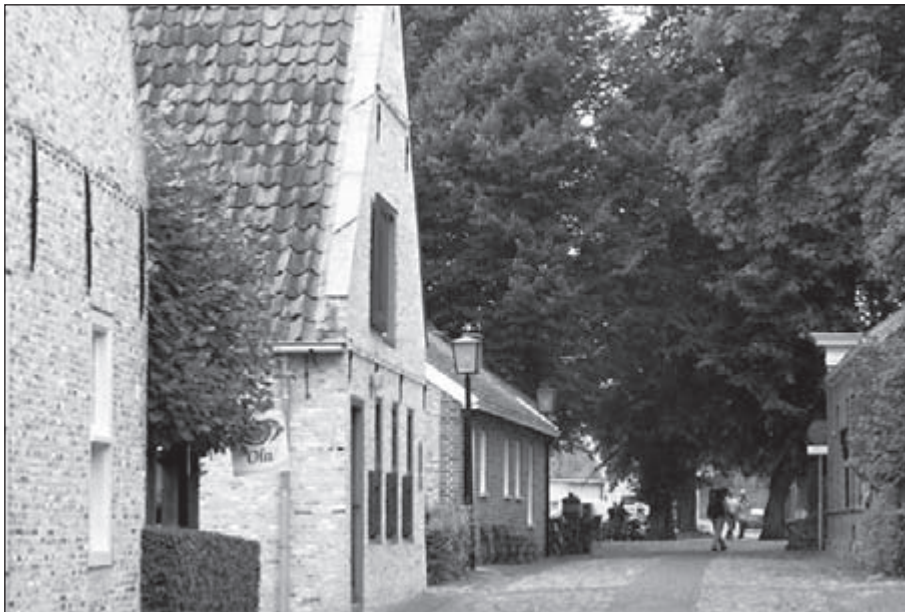
Het vestingstadje Bourtange

De volgende dag was het miezerig en 's nachts had het geregend. We gingen op weg met droog weer. Onderweg naar Klazienaveen kwamen we in een nieuw kassencomplex terecht, waar de markering een zoekplaatje was. Toch vonden we de goede route en in het Oosterbos liepen we door het hoge gras langs een beekje. Gevolg was dat mijn hoge schoenen goed nat werden, en mijn sokken ook. Ik had mijn schoenen