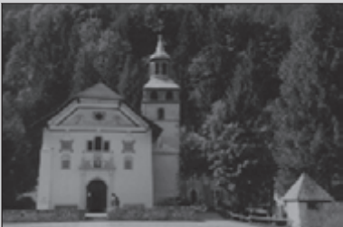
Tour du Mont Blanc 20-23