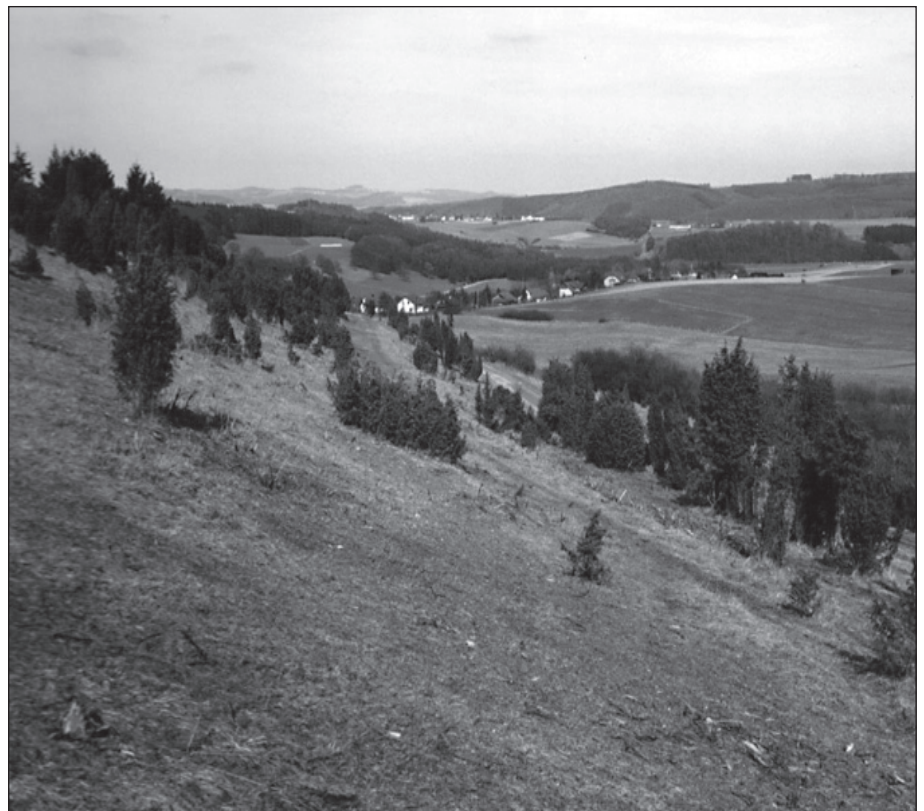
Jeneverbessen in het ochtendlicht

Op het topje van de Arensberg, ook wel Arnulphusberg, bevindt zich de belangrijkste droge krater uit de vulkaangroep in de Eifel. Volgens de kaart moet de toegang zich nabij een grasveld bevinden, waar bedevaartgangers te voet samenscholen om Arnulphus