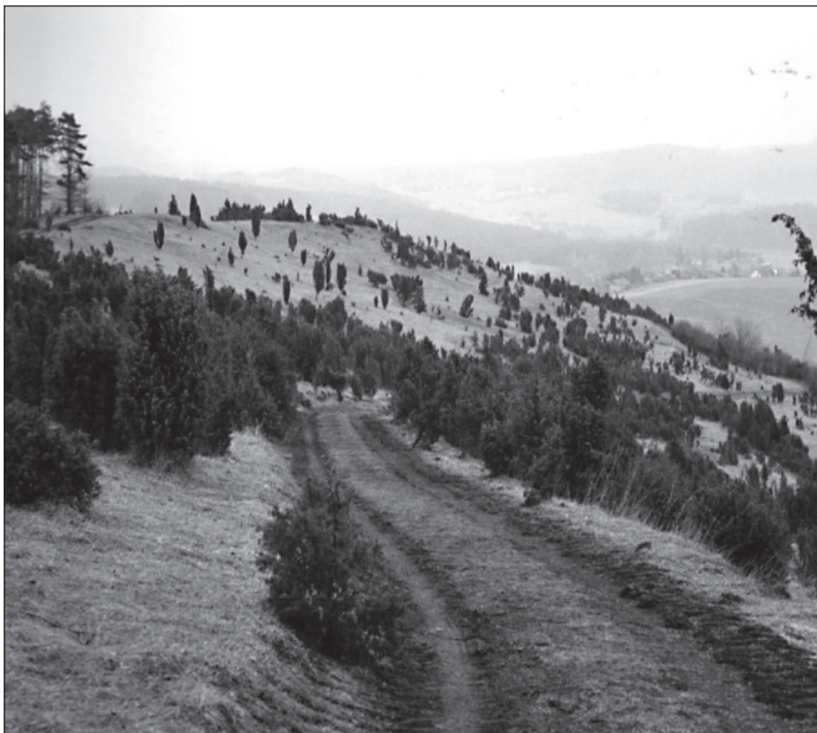
Jeneverbessen blakend in het namiddagzonnetje

Bron: Natuur totaal.nl/Brabants Dagblad , 1 dec. 2005